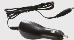
Adaptateur pour allume-cigare Permet de recharger l'imprimante dans un véhicule.